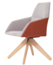
607 ミーティングチェア (ピラミッド木製脚) 張地：天然皮革・布地・合成皮革 脚：ビーチ無垢材 ウレタン塗装仕上(回転機能付) W595 D625 H900 SH450