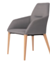
604 ミーティングチェア (木製四本脚) 張地：天然皮革・布地・合成皮革 脚：ビーチ無垢材 ウレタン塗装仕上 W595 D625 H900 SH450