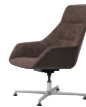
611H ラウンジチェアハイバック (ベース十字脚) 張地：天然皮革・布地・合成皮革 脚：アルミポリッシュ仕上 (回転機能付) W680 D710 H920 SH400