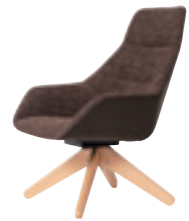
617H ラウンジチェアハイバック (ピラミッド木製脚) 張地：天然皮革・布地・合成皮革 脚：ビーチ無垢材 ウレタン塗装仕上 W680 D710 H920 SH400