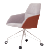
603 ミーティングチェア (ピラミッドパイプ脚) 張地：天然皮革・布地・合成皮革 脚：スチールパイプ焼付塗装仕上 W595 D625 H900 SH450