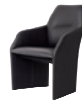
602 ミーティングチェア (パネル脚) 張地：天然皮革・布地・合成皮革 脚端：プラスチック樹脂 W595 D625 H900 SH450