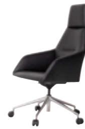
605H ミーティングチェアハイバック (5本脚) 張地：天然皮革・布地・合成皮革 脚：アルミポリッシュ仕上 (上下昇降機能付) W595 D625 H1100-1165 SH410-475