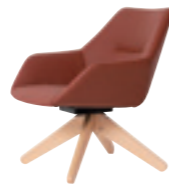
617 ラウンジチェア (ピラミッド木製脚) 張地：天然皮革・布地・合成皮革 脚：ビーチ無垢材 ウレタン塗装仕上 W680 D660 H740 SH400