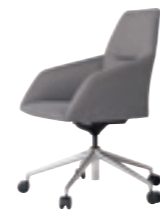
605 ミーティングチェア (5本脚) 張地：天然皮革・布地・合成皮革 脚：アルミポリッシュ仕上 (上下昇降機能付) W595 D625 H860-925 SH410-475