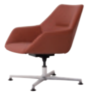
611 ラウンジチェア (ベース十字脚) 張地：天然皮革・布地・合成皮革 脚：アルミポリッシュ仕上 (回転機能付) W680 D660 H740 SH400