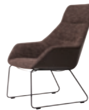
616H ラウンジチェアハイバック (ループ脚) 張地：天然皮革・布地・合成皮革 脚：スチールパイプ焼付塗装仕上 W680 D710 H920 SH400