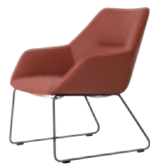
616 ラウンジチェア (ループ脚) 張地：天然皮革・布地・合成皮革 脚：スチールパイプ焼付塗装仕上 W680 D660 H740 SH400