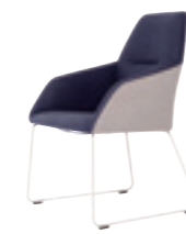
606 ミーティングチェア (ループ脚) 張地：天然皮革・布地・合成皮革 脚：スチールパイプ焼付塗装仕上 W595 D625 H900 SH450